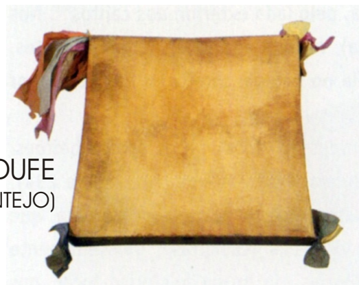
ADUFE (BEIRA BAIXA E ALENTEJO)