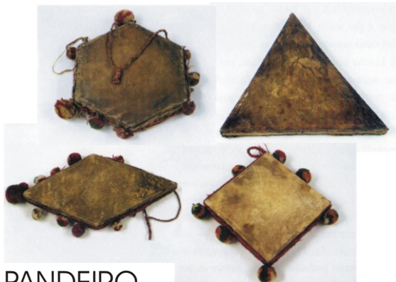
PANDEIRO (TRÁS-OS MONTES)