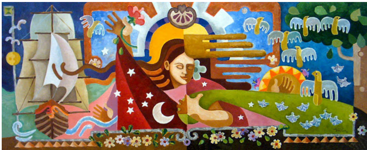
Fábio Luna. Ofrenda | 160 x 65cm | 2008

http://fabiolunarte.blogspot.pt/p/exposicao-brincar-de-que-vamos-brincar.html , [10/01/2022